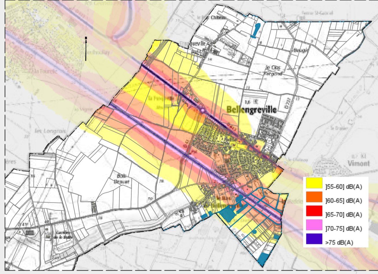
Carte de type A isophones de nuit (seconde échéance) à l'échelle 1/25000è, prise en compte de la DDTM (état de la connaissance au 22 janvier 2014)