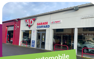
Le garage automobile Coiffard