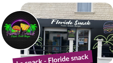
Le snack - Floride snack