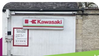
Le garage de réparation de moto Moto pièces Bertrand