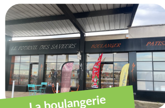
La boulangerie Le fournil des saveurs Maison Formentin