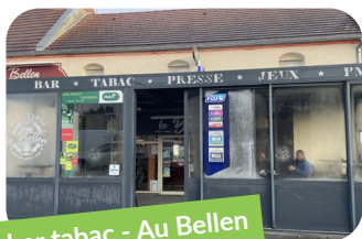
Le bar tabac - Au Bellen