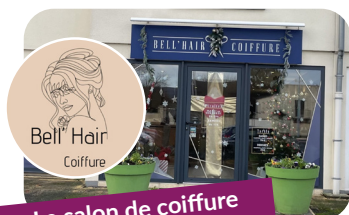
Le salon de coiffure Bell/hair coiffure