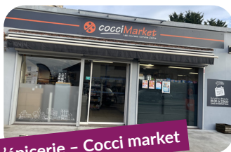
L'épicerie - Cocci market