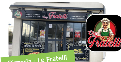
Pizzeria - Le Fratelli